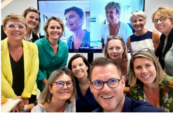
d'ajustement de la formation DS.